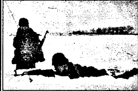
Vigilenți, în așteptarea adversarului.

În raionul Mișca - Șepreuș - Adea - Sintea Mare, subunități de infanterie și artilerie execută o aplicație tactică cu trupe și tehnică în teren, activitate cuprinsă în planul pregătirii de luptă. Această aplicație este corolarul activităților și al eforturilor statului major și al subunităților pe parcursul unui an de instrucție, pentru contingentele de militari în termen care va trece în rezervă peste câteva zile. Pentru acești soldați activitatea din teren are o însemnătate cu totul aparte, fiind un examen al maturității ostășești. Tot cu acest prilej se realizează