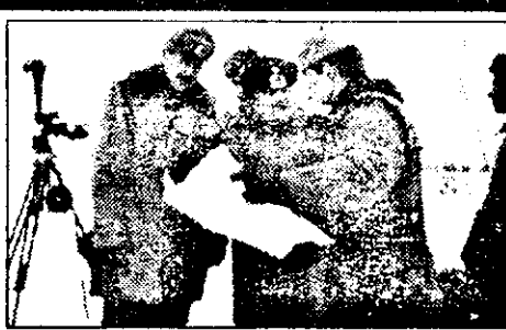
Planul de luptă, cercetat cu atenție pe harta raionului de aplicație.

Pentru asigurarea succesului evenimentelor similare viitoare, comandantul companiei precizează că subunitatea va fi sprijinită în acțiunile de luptă și de o baterie de obuziere, comandată de cpt.