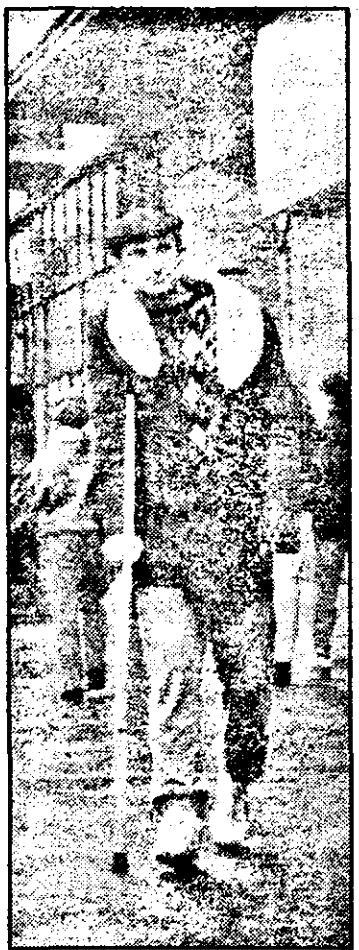
„În iarnă asta, de gripă am scăpat, dar cu o cizmă de ghips tot m-am ales...”