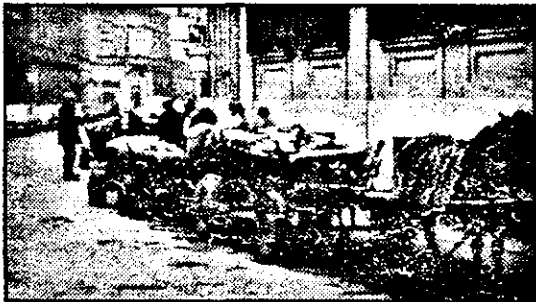
Când MATCOMB-ul tace, particularul face. E drept, pe riscul lui...