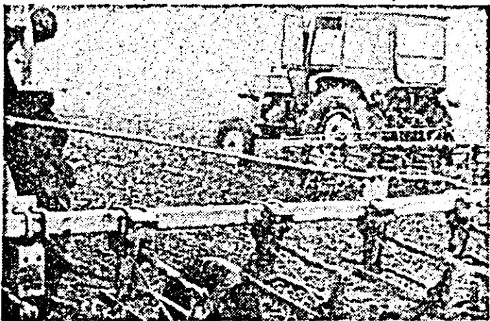
În ciuda timpului capricios, organizându-se bine munca, trebuie folosit fiecare moment prielnic la prașit.