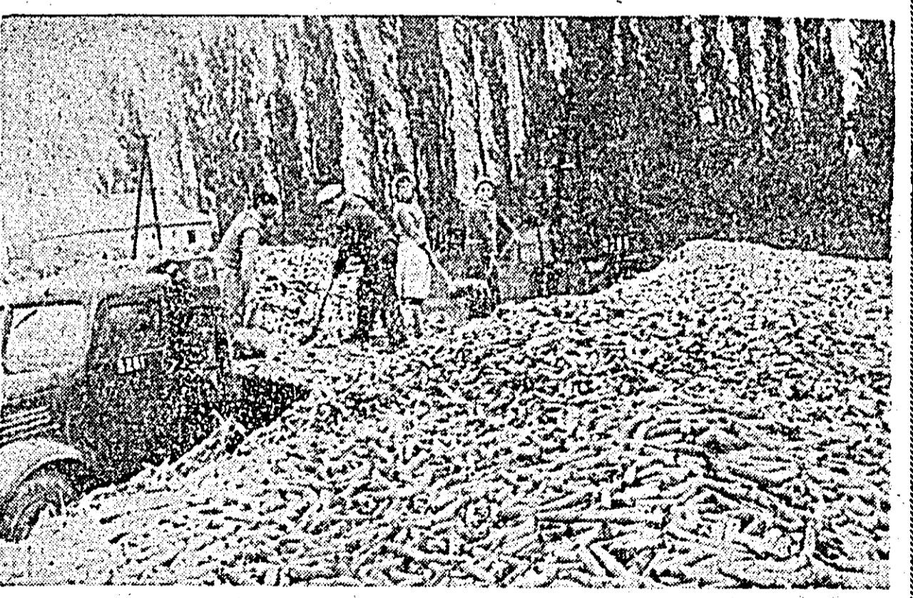
La gospodăria de stat din Utvinș, secția Canton, recoltatul porumbului s-a făcut pe mari suprafețe. Din lan camioanele încărcate cu rodul muncii transportă de zor porumbul spre depozitare. ÎN CLIȘEU: se descarcă un nou transport de porumb.