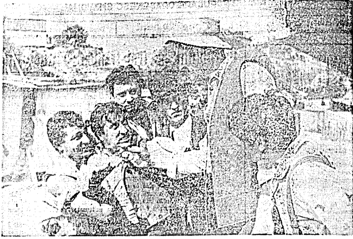
ÎN CLIȘEU: o scenă din filmul „Codin” care va rula pe ecranul cinematografului „N. Bălcescu” din Arad.