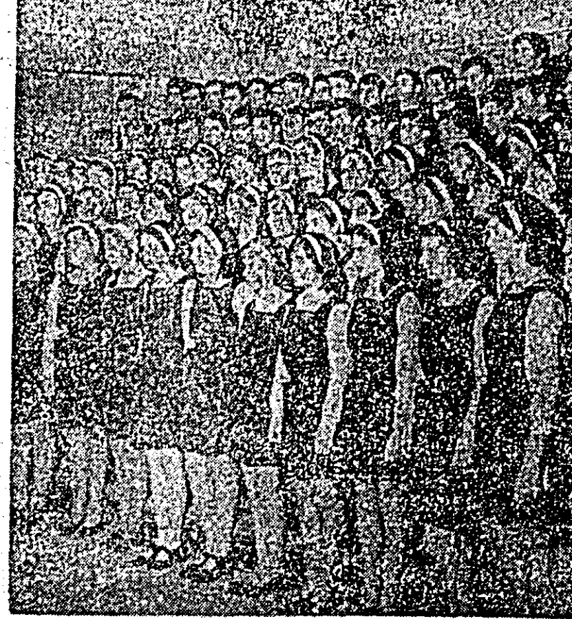
„Ioan Slavici”