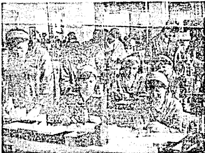
În orele de practică productivă, elevii Liceului Industrial nr. 13 Arad se pregătesc cu seriozitate pentru a deveni muncitori cu înaltă calificare al întreprinderii de orologerie industrială.

— Sînt multe organizații de tineret din industria municipiului Arad care au tradiție și în activitatea de cercetare tehnico-stiințifică sau în activitatea culturală — domenii în care noi va trebui să ne intensificăm preocupările. Ambițiile uteciștilor noștri sînt pe măsura tineretii lor.