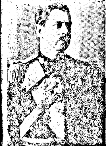
M. S. REGELE CAROL II.

La orele 15, noul guvern Gigurtu a depus jurământul de credință.