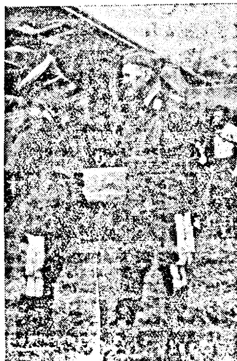
Generalii germani Udet și Loerzer

Moscova, 5. (Rador.) — Consiliul suprem al Uniunii Sovietice a primit demisia lui Caganovici, comisar al poporului pentru petrol și a numit pe d. Sedin ca noul comisar.