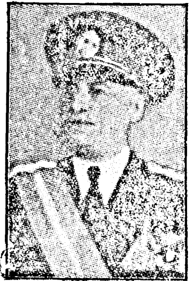
D. ING. ION GIGURTU Președintele Consiliului de Miniștri