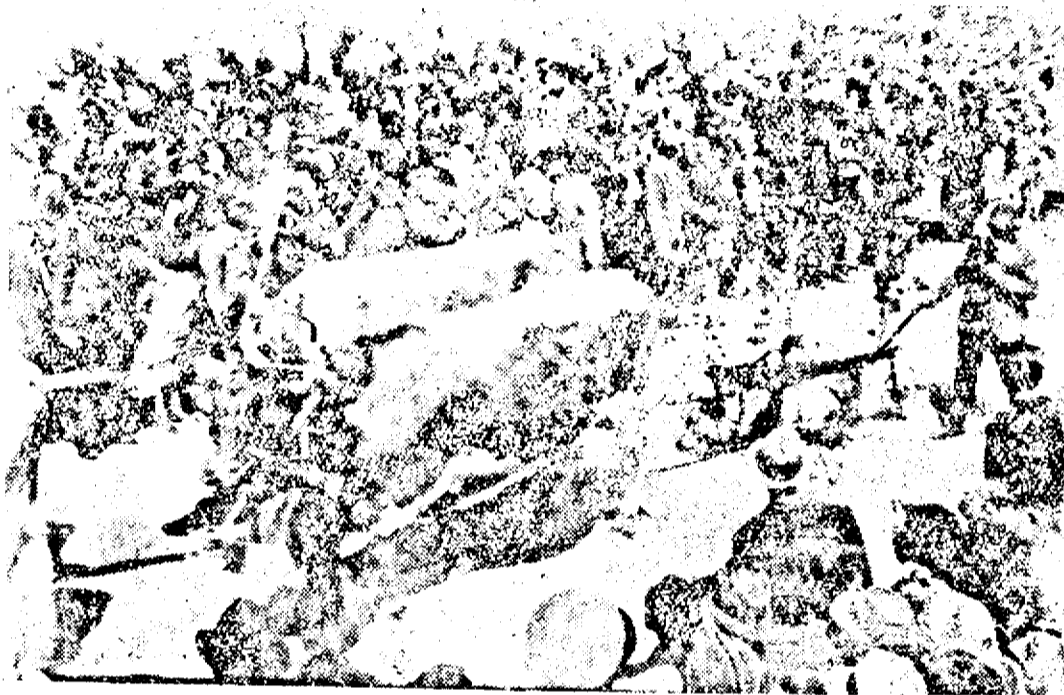
Plugarii sărbătoresc și ei Ziua Muncii