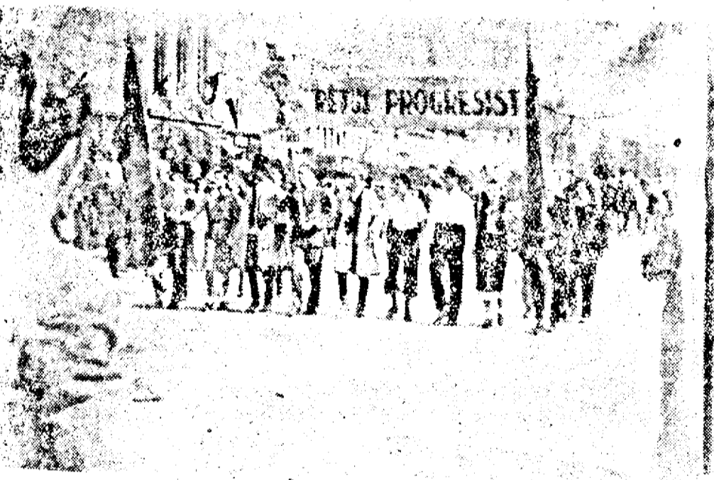
Tineretul muncitor, țăran și intelectual înfrățit sub steagul Tineretului Progresist