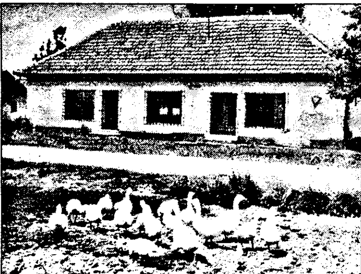
După desfiinţarea magazinului alimentară, în urmă cu doi ani, sătenii Cuveşdiei sunt nevoiţi să meargă „pe sate” după cele necesare.