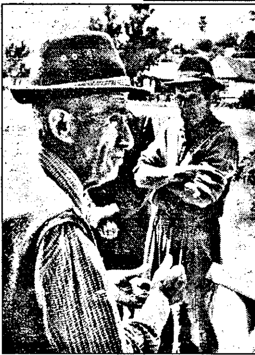
— Dom’le, la noi în sat n-a mai fost o nuntă de 20 de ani. Da’ pă vremuri era o viaţă...

merit, după 30 de ani de muncă la C.A.P.?”. În tot satul sunt vreo 13 vaci, care însă asigură laptele pentru toţi sătenii. Bătrâni fiind, mulţi nu-şi pot lucra pământul, aşa că l-au introdus în asociaţie, dar, din păcate, n-au primit grăul nici pentru anul trecut... Cel puţin, până la ora documentării noastre.