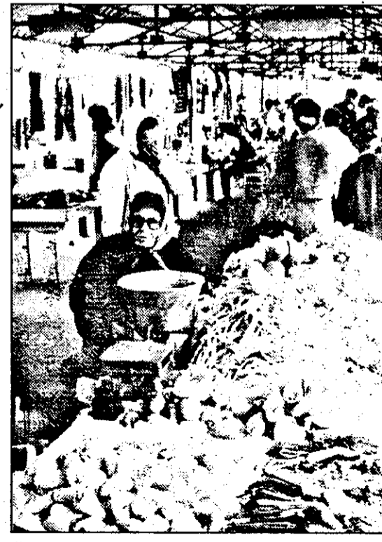
Piața din Lipova - o piață modernă, acoperită și, după cum se vede, bine aprovizionată.

Că proprietarul Daciei 1310, parcată în noaptea de 4/5 pe stradă Voinicilor, în fața blocului 109, a constatat duminică dimineață că parbrizul mașinii sale e atât de transparent pentru că... fusese furat, că un microbuz Renault, parcat pe str. Gogol în fața blocului 6, a rămas și el fără parbriz - este într-un fel „explicabil”. Dar dacă nici apăpostite într-un punct termic, care se presupune că e permanent supravegheat, mașina nu mai e în siguranță... Drept dovadă, în noaptea de 4/5 august, din Dacia 1310 cu nr. AR-02-WBO, parcată în incinta punctului termic nr. 32 din Faleză Sud, a fost furată roata de rezervă și, după ce au spart geamul de la portieră, hoții au săltat și un radiocasetofon Philips. Și nimeni nu a văzut și nu a auzit nimic.