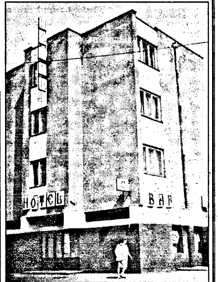
Un hotel frecventat mai degrabă pentru serviciile de bar și restaurant. Că de dormit...