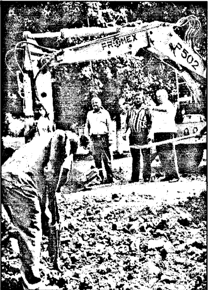
Primarului i se dă raportul „pe puncte”. Să știe, nu de alta, unde se află și încotro merg... lucrările.

*** În altă ordine de idei, am aflat foarte multe lucruri despre tinerii