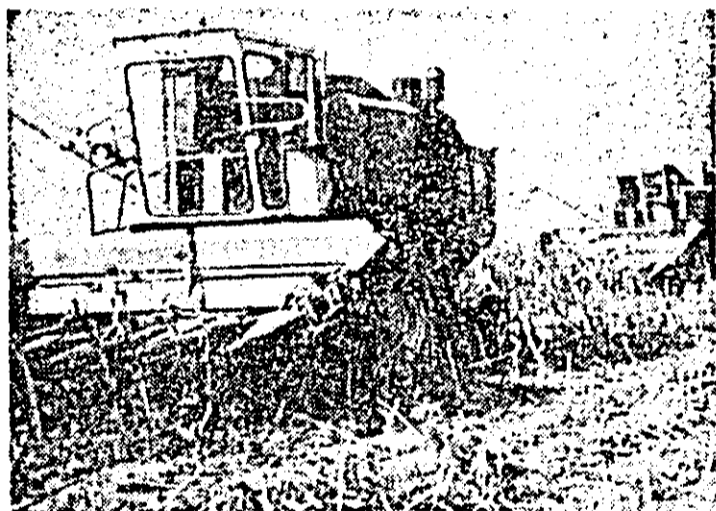
Se recoltează floarea-soarelei la C.A.P. Tîrnova.