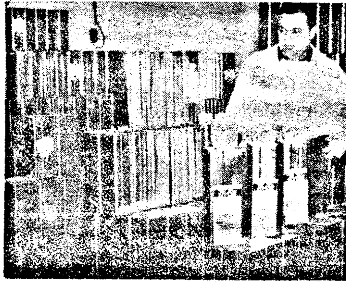
Întreprinderea de industrializare a cărnii Arad. Cuii mai mari și mai mici cu șuncă, stive întregi pregătite spre a ajunge acolo unde era și este firesc să ajungă: pe masa fiecăruia.

● O.J.T. dispune de locuri de odihnă și tratament în toate stațiunile din țară. Se reaminteste că în perioada 4—17 ianuarie tariful pentru cazare se reduce cu 20 la sută. Detalii la filiala de turism intern din Bulevardul Republicii nr. 72, telefon 37279.