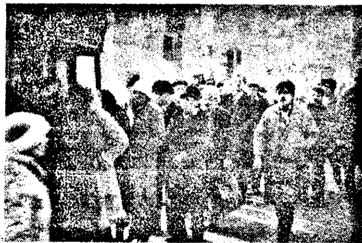
Ziarele — mult solicitate în aceste zile.

Pe podul de la Aradul Nou a rămas o lozincă cu un conținut fără acoperire. Ar fi o impietate să o mai redăm în ziar, dar și mai mare impietate dacă mai rămîne acolo. Dați-o jos repede, oameni buni!