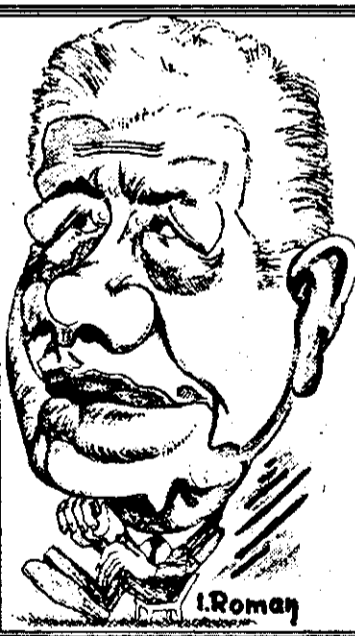
JIMMY CARTER: - La vârsta mea, nu face să-l mai ațese pe Eugen Ionesco, mai ales că pretențiile UDMR sunt tot de domeniul teatrului absurdului!...

trebuie să învingă. Ambele părți trebuie să fie dispuse să facă compromisuri rezonabile. Dar, în orice caz, beneficiile trebuie să fie întrecute în concesiile