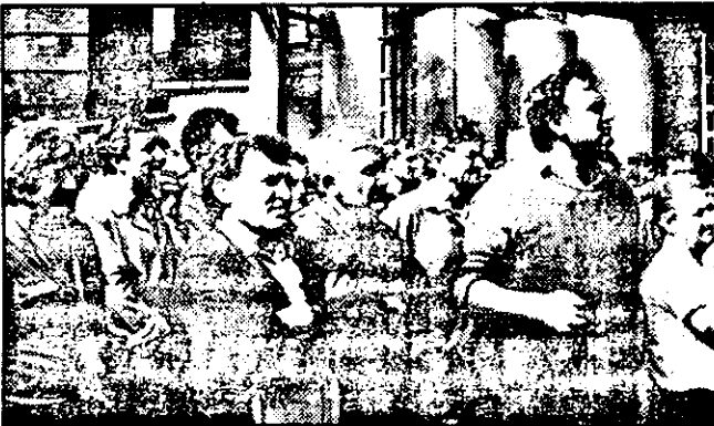
Pe fețele muncitorilor de la ASTRA se putea citi ieri îngrijorare, teamă, incertitudine, dar și un licăr de speranță.

„Dărzenia cu care luptați pentru păstrarea locurilor de muncă, pentru viitorul fabricii precum și pentru combaterea birocrăției și imobilismului care caracterizează luarea deciziilor în cadrul structurilor guvernamentale, merită toată stima și respectul nostru.” Comunicatul este semnat de Aurel Radu, președintele FNS METAROM.