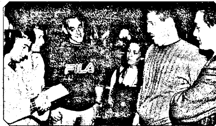
Ziaristii de la „Adevărul” într-o discuție cu delegația echipei israeliene în holul Hotelului Astoria.