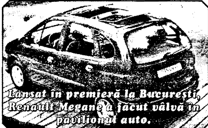
Lansat în premieră la București, Renault Megane a făcut valva în pavilionul auto.

P. S.: Deplasarea a fost sponsorizată de societatea „Dacia-Service” Aradul-Nou, căreia îi mulțumim.