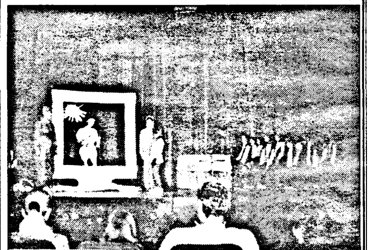
Pe scenă, în „Penelopa și calculatorul”.

Plini de energie, la orice oră din zi și din noapte, oricând gata de joacă, de vorbă, de disco, „miniamifrani” au de ce să le fie recunoscători lui „dom”