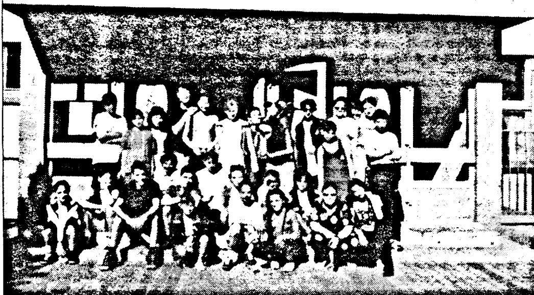
Echipa pozează în fața școlii

studentă la franceză - olandeză, în orașul Ghent. „Lipsa scenei m-a aruncat la Budapesta”. Acum joacă în trei teatre de primă mână din capitala Ungariei, are trei-patru roluri principale într-o stagiune, colaborează cu posturi de televiziune și de radio.