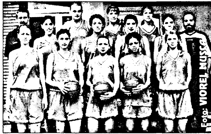
Ele sunt fetele de la BC ICIM, în care ne punem speranțe pentru un nou titlu național.