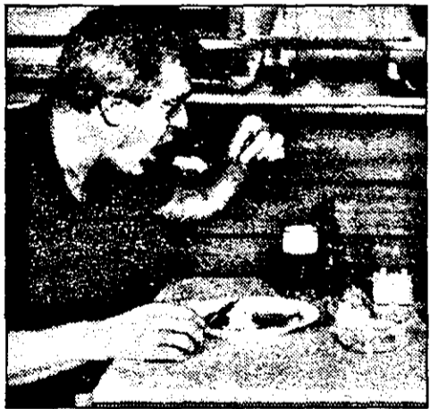
soanele care prezintă un surplus ponderal trebuie să aibă un regim mai sărac în calorii, pentru a-și reduce greutatea. Mesele trebuie să fie în număr de cinci-

Alimentația se va face în funcție de starea de nutriție a persoanei bolnave. De pildă, per-