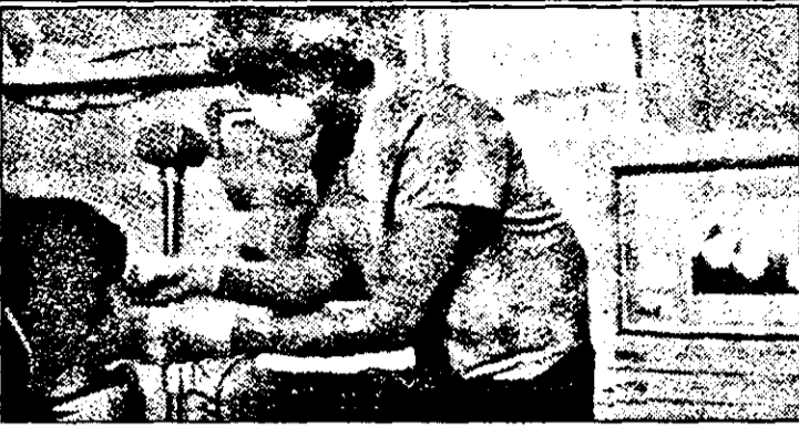
Radlografie dentară asistată de calculator

➤ Radiografia dentară asistată de calculator este o inovație pe care practicienii au început să o generalizeze. Ea folosește toate principiile radiografiei tradiționale, cu diferența (esențială), că filmul este înlocuit cu un captor cu raze X, plasat în cavitatea bucală a pacientului. Astfel, se obține o imagine instantanee, ce poate fi corijată. Timpul de expunere la razele X este divizat cu 5, reducându-se, în acest fel, cu 80% doza de iradiere. ➤ Aplicarea unui regim fără sare înseamnă și reducerea consumului de alimente ce conțin calciu. Cercetătorii olandezi au