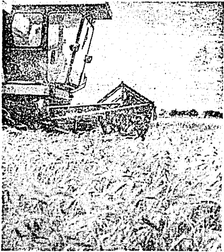
În unități agricole din C.U.A.S.C. Vinga, combinele au început să adune recolta de orz.

te, între altele, și faptul că în perioada trecută de la începutul anului și pînă în prezent colectivul compartimentului creație a realizat 750 articole noi de confecții (fuste, jachete, paltoane etc.) față de 455, cite au fost stabilite pentru intervalul de timp la care ne referim, dintre care 225 articole noi au fost introduse în fabricația curentă.