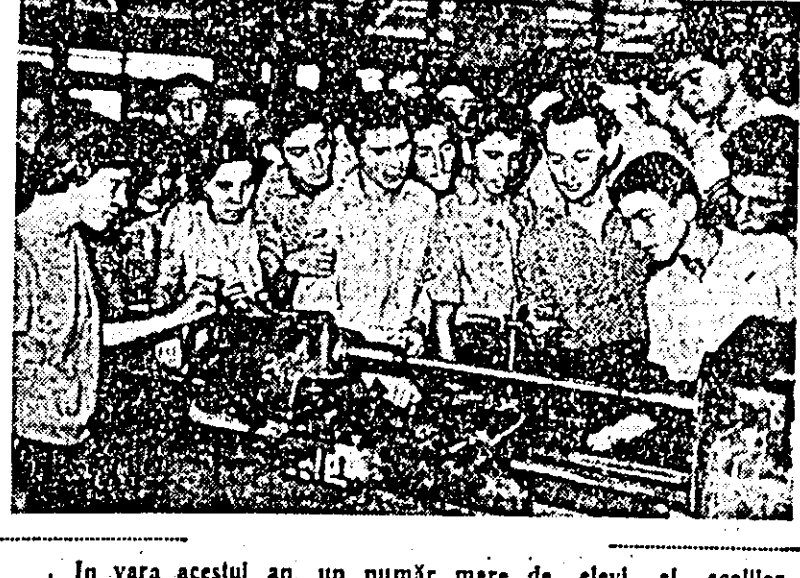
În vara acestui an, un număr mare de elevi ai școlilor medii din Dobrogea au vizitat, cu prilejul excursiilor organizate în țară, o serie de obiective economice. În cișeu: un grup de elevi în vizită la uzinele „I. Rangheț” din Arad.

În raion continuă să se însilozeze zilnic însemnate cantități de porumb siloz. În gospodăriile de stat, bunăoară, s-au însilozat pînă acum peste 4.900 tone de porumb siloz. Cete mai bune rezultate în această direcție s-au obținut la GAS Coala, unde s-au însilozat cea 60 la sută din cantitatea planificată. La GAS Vinga s-au însilozat peste 800 tone, la Utrivni 700 tone, la Șirfa 610 tone etc. În gospodăriile colective din raion s-au însilozat 6340 tone de porumb. În frunte se găsește gospodăria colectivă din Șirfa, unde s-au însilozat 1700 tone, urmată de GAC Orșoara unde s-au însilozat 1030 tone, apoi Horla, Zădăreni etc.