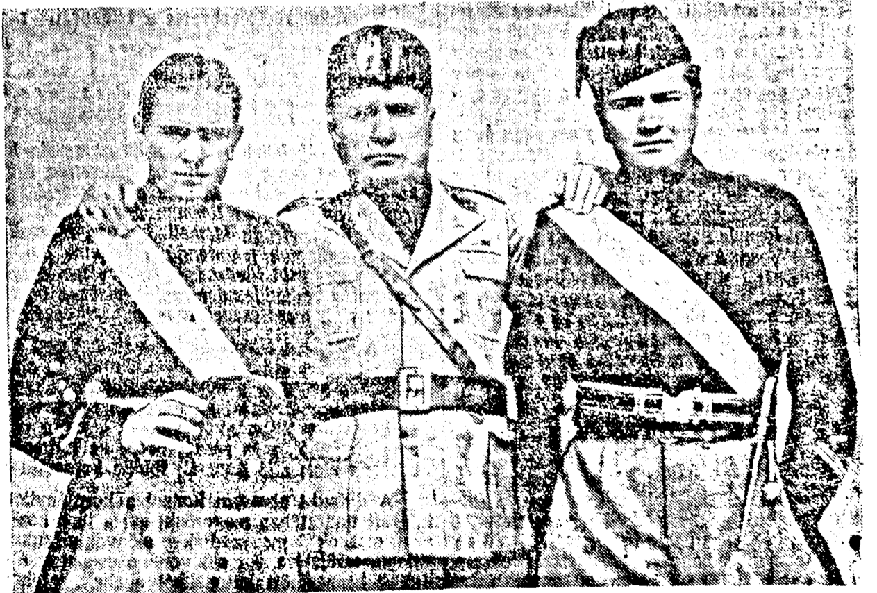
MUSSOLINI, KÉT FIÁVAL, A MOZGÓSÍTOTT FEKETEINGESEK EGYENRUHÁJÁBAN (Az olasz miniszterelnök legutolsó portréje, amely akkor készült, midőn két fiától, akik Keletafrikába mentek, elbucszott.)

A nemzetközi helyzet állandóan és változatlanul súlyosodik. Az angol király ma délután