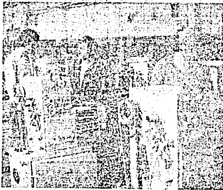
În montajul întreprinderii de mașini-unelte, un nou lot de strunguri se apropie de finalizare.

Aspect de muncă la linia de montaj ceasornice a întreprinderii „Victoria” Arad.