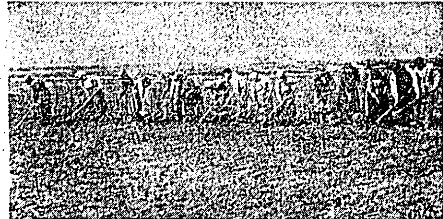
Printre primii care au început prășitul sîclei de zahăr sînt și colectivitățile din Vladimirescu.

ÎN CLIȘEU: Un grup de colectivități după terminarea însămînțărilor.