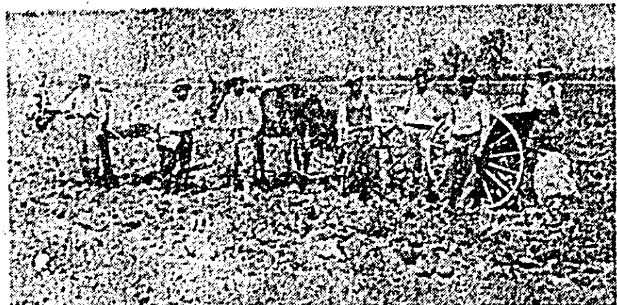
Cei dinți care au terminat în acest an însămînțările de primăvară au fost colectivitățile din Chesinț, ralonul Lipova.

ÎN CLIȘEU: Un grup de colectivități după terminarea însămînțărilor.