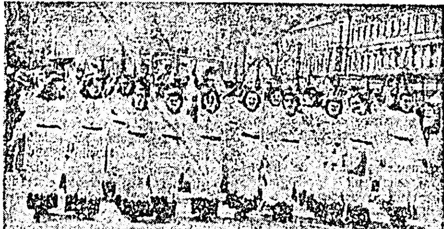
Coriștii din ansamblul artistic al cooperativei „Artek” trecînd prin fața tribunelor.