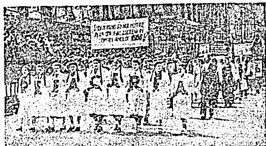
Trec muncitorii de la fabrica „Refacerea”, care și-au realizat planul cincinal în 3 ani și 11 luni.