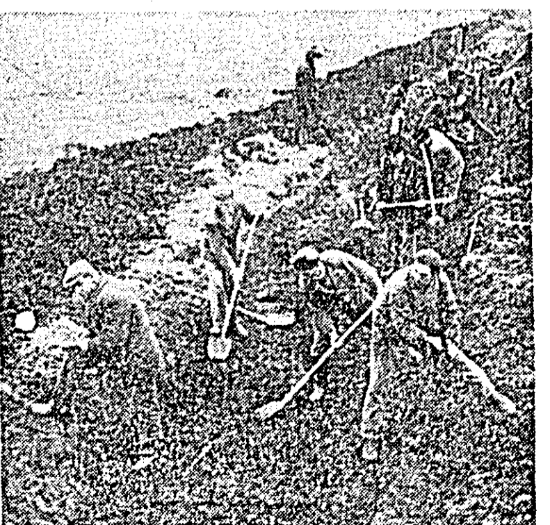
Pe șantierul intercooperatist de la Șofronea — Curtici — Iratoș, vrednicii cooperatori din Sinmartin muncesc cu rîvnă la lucrările de desecare.