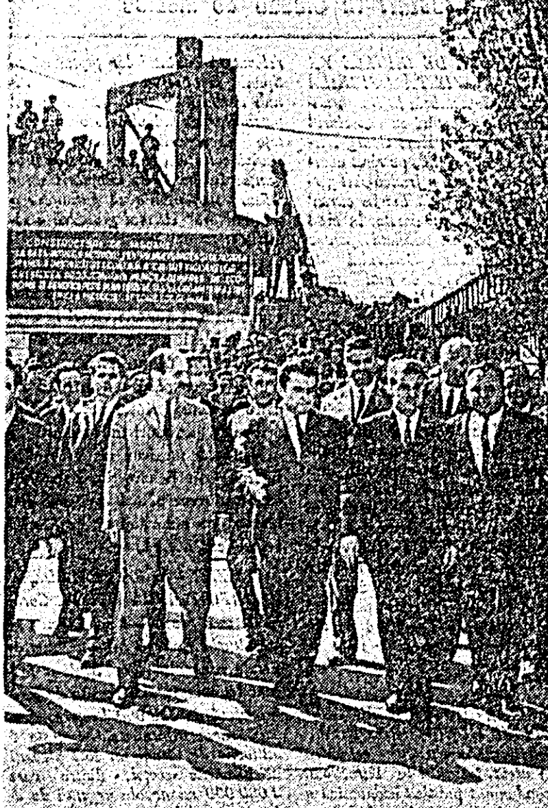
Înalții oaspeți în incinta Uzinelor de vagoane din Arad.

ducătorii poporului nostru și soli năzuind să-l salveze. Poporul român, plămădit de-a lungul mileniilor, la răscrucea drumurilor istoriei, s-a format și s-a câlît în luptă pentru o cauză dreaptă, pentru independență, libertate națională și socială. A rezistat tuturor încercărilor istoriei datorită credinței în această cauză, unității și înțelepciunii sale. De-a lungul veacurilor, cărturarilor neamului nostru au fost întotdeauna alături de popor. Astăzi se poate spune că intelctualitatea este nu numai alături de popor, ci este trup din trupul poporului, devotată cauzelor lui, cauzelor construcției socialiste.