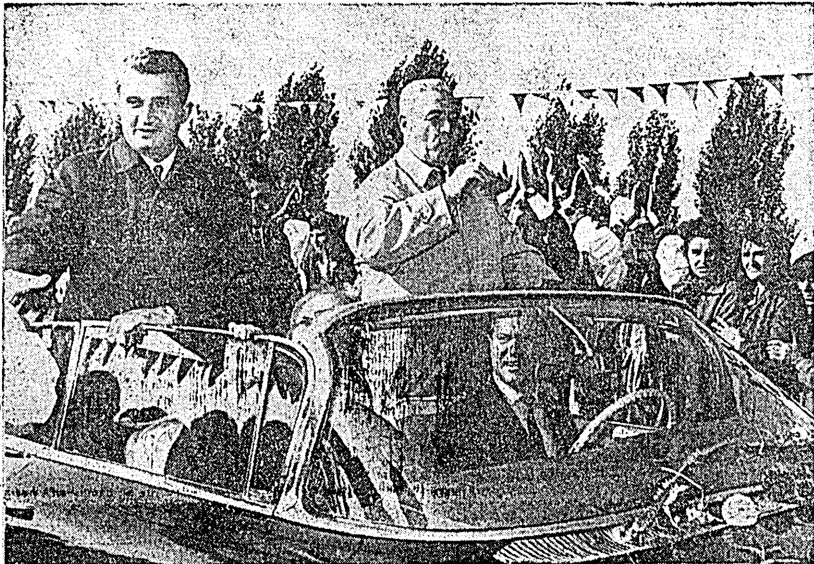
Pe întregul traseu conducătorii de partid și de stat sînt sãlutați cu cãldurã și entuziasm de mii și mii de locuitori ai județului și municipiului Arad.