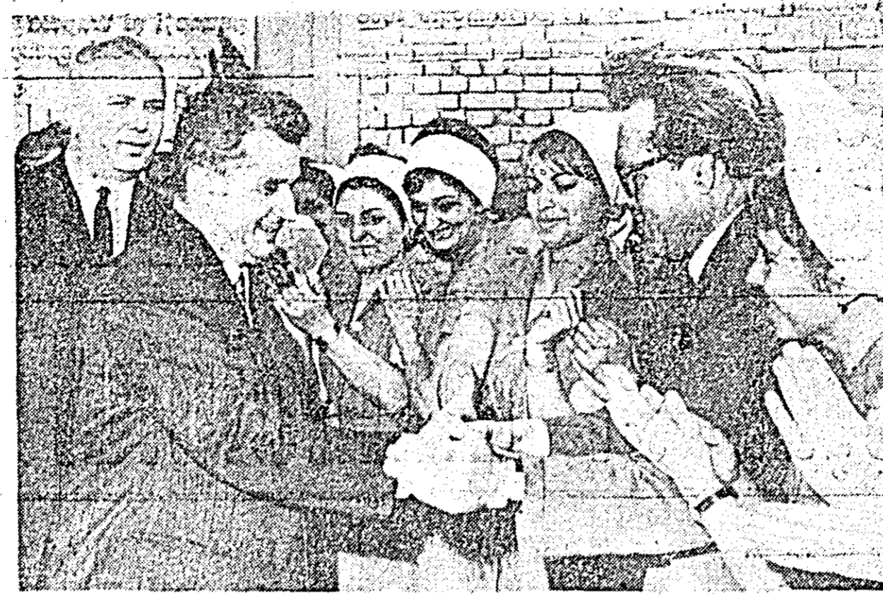
În mijlocul harnicilor țesături arădene.

Pe străzile orașului de pe Mureș, pavozat sărbătorește, s-au strîns, în aceste ore ale dimineții, zeci de mîi de oameni români, maghiari, germani și de alte naționalități, din toate generațiile, care își manifestă cu deosebită căldură dragostea și atașamentul față de partid, întruchiură vie a coeziunii întregului popor în jurul partidului, a conducerii sale.