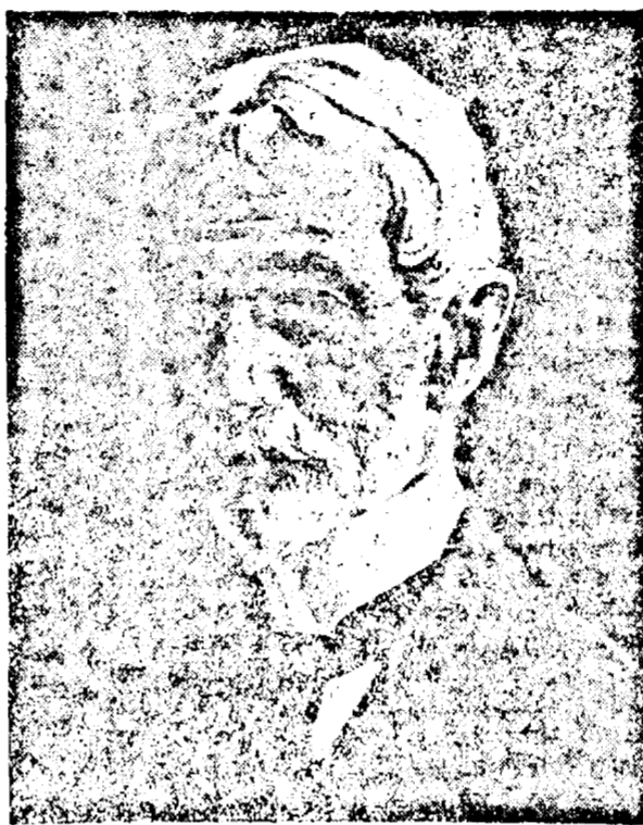
D. Prim-ministru General AL. AVERESCU

bisericesc — sinodul din 1917 — sunt evenimentele, cari nu se vor putea scrie și aminti, fără a pomeni cu recunoștință și admirație numele secretarului consistorial din Arad.