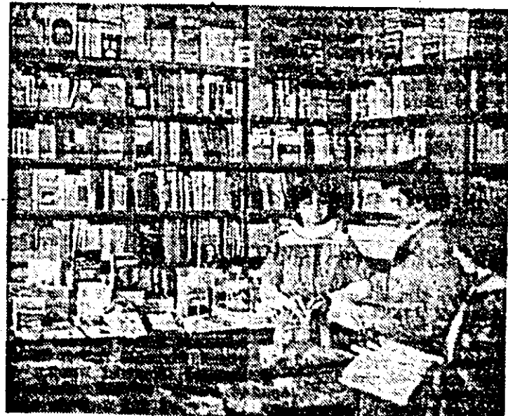
Setea de carte și cunoaștere este astăzi o dimensiune a vieții noastre cotidiene. În imagine: tineri cititori în căutarea cărții prelerate.