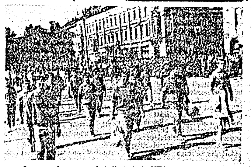
În pas cadențat trec fotbalistii de la UTA.

tului național. Închinînd aceste succese măreței sărbători, ei sînt hotărîți să înscrie pe palmares încă multe victorii. Desfășurarea sportivilor din orașul nostru a constituit o adevărată demonstrație de sănătate, forță și viziune. ȘT. IACOB