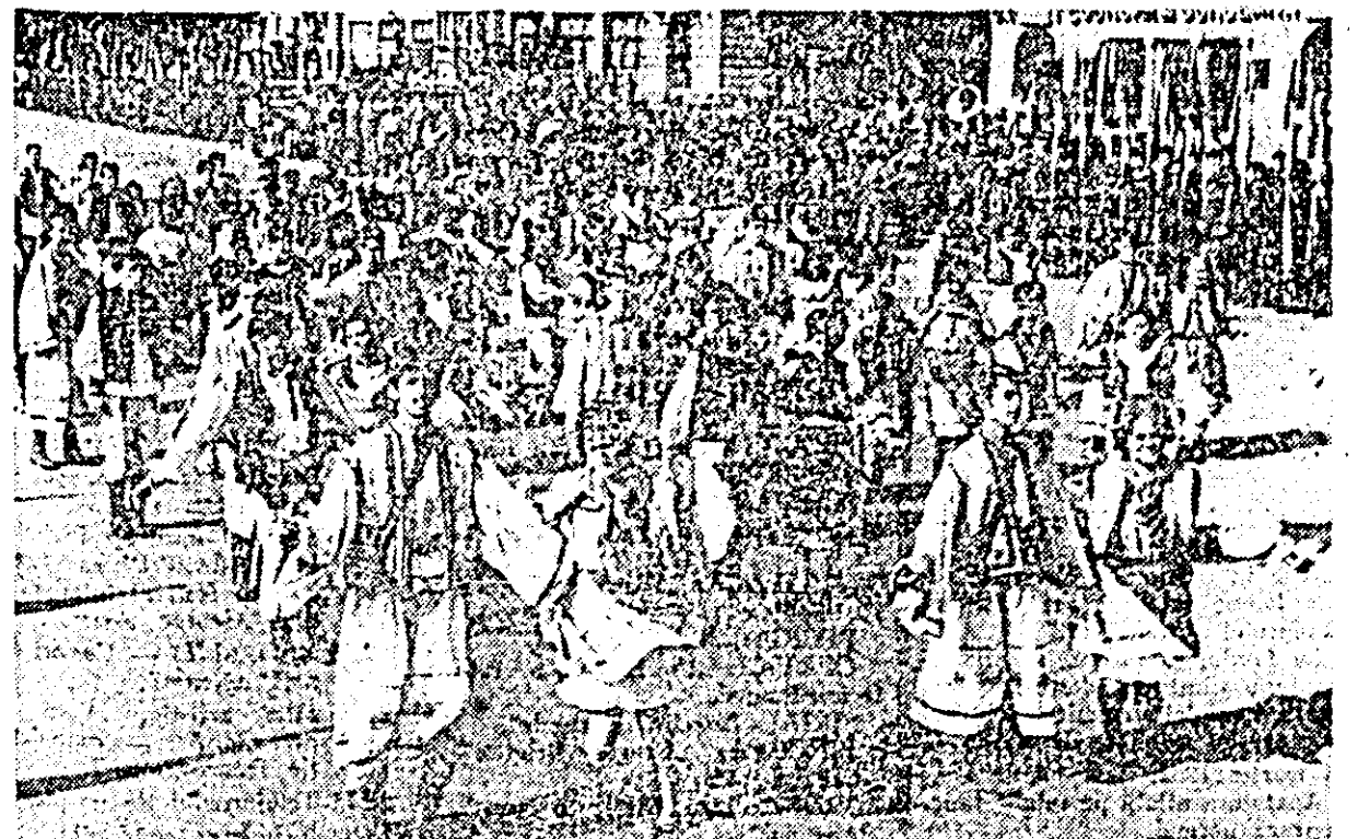
Ritm și voieșie exprimat de dansatori.