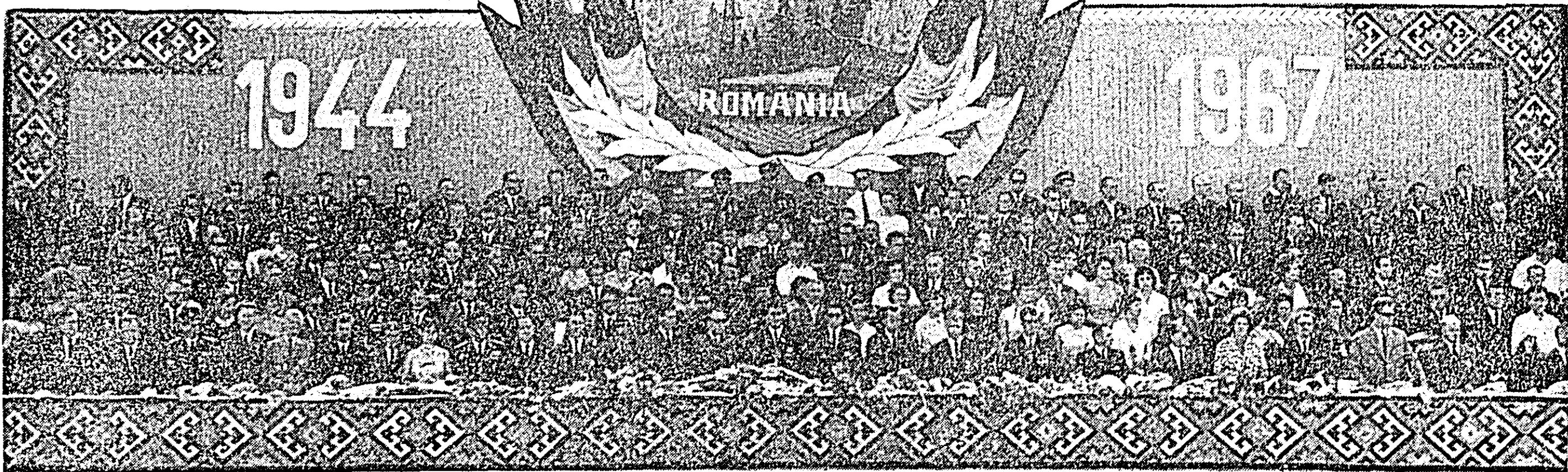
TRIBUNA OFICIALĂ ÎN TIMPUL DEMONSTRAȚIEI OAMENILOR MUNCII DIN ORAȘUL ARAD.