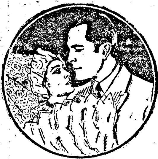
John Boles és partnere

Jack Hylton és zenekara Ragamuffin Romeo AM 2953