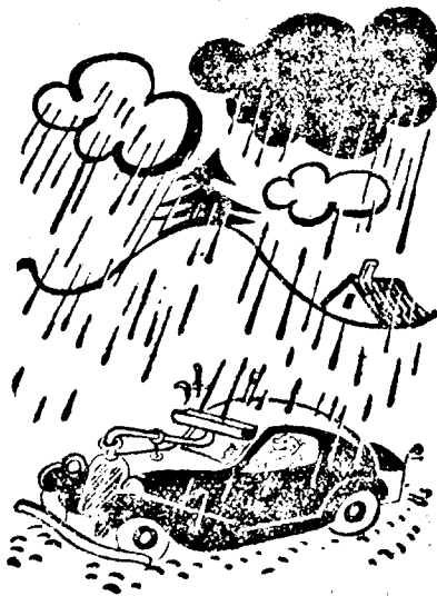
Esős tavaszi időben az autó-hűtő automatikus víz-ellátására.