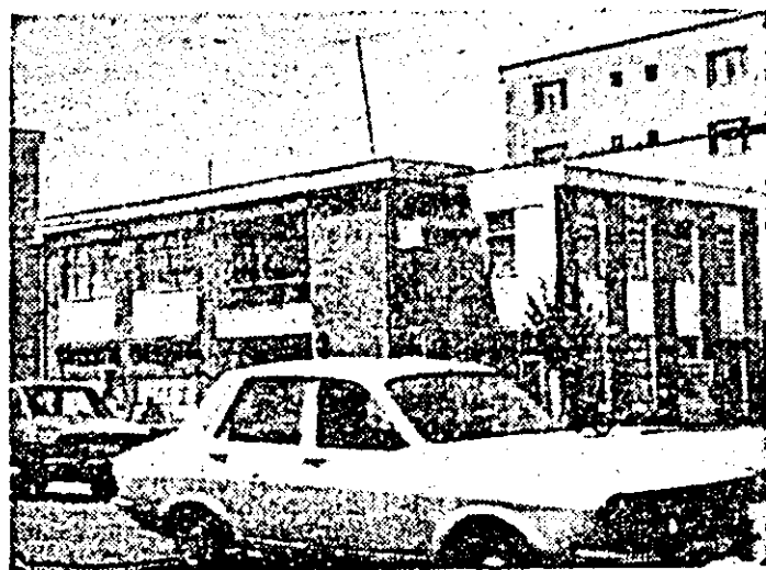
Instantaneu tulidian la Chișineu Criș.

se impune reducerea absențelor nemotivate și învolirilor, înmînarea disciplinei. De asemenea, ritmul muncii, realizarea cantitativă și calitativă a sarcinilor de producție nu are, potrivit limitelor categoriilor profesionale, aceeași intensitate în toate locurile de muncă. Iată de ce, forța de muncă, utilizarea ei eficientă, constituie și pentru semestrul II o permanentă a activității comitetului de partid și a consiliului oamenilor muncii din întreprinderea noastră.