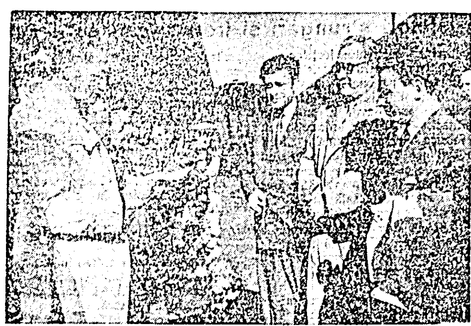
Cliseul reprezintă pe membrii Filarmonicii din Belgrad la sosirea în gara Arad.

sale, noi am fost înconjurați cu dragoste și prietenie" — a spus Cresimir Baranovic.