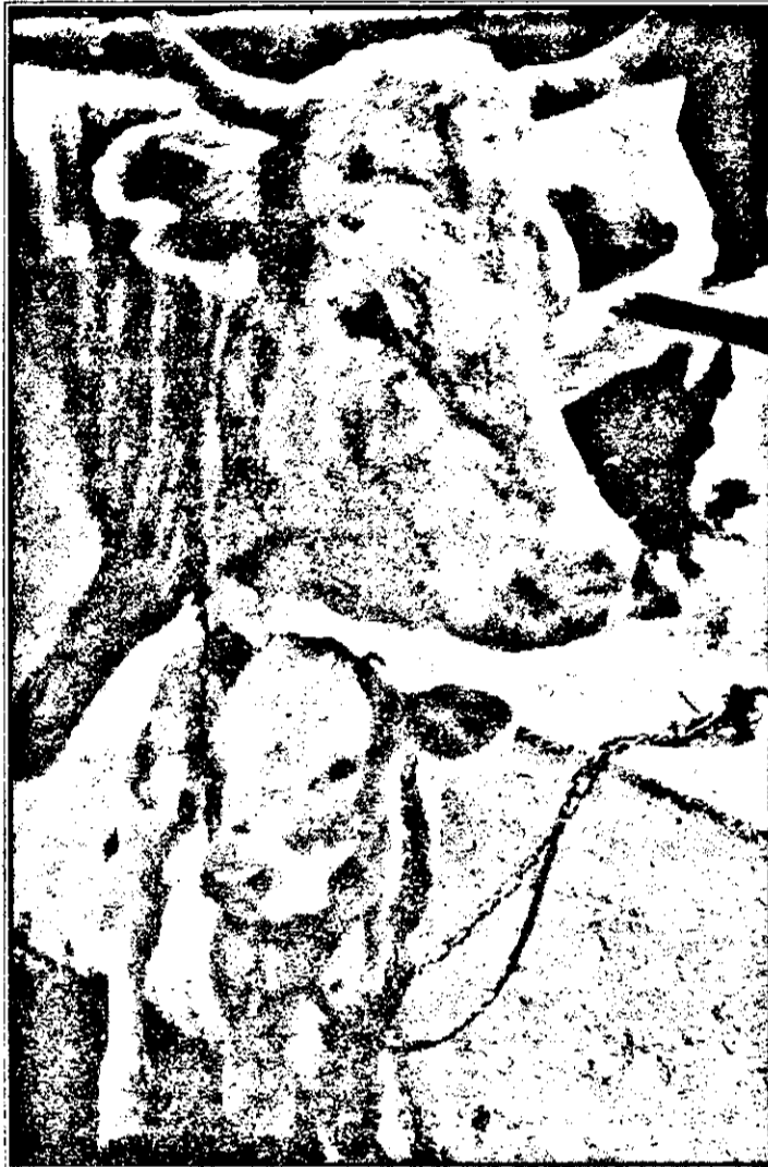
Mama și fiica în așteptarea unor zile mai bune.