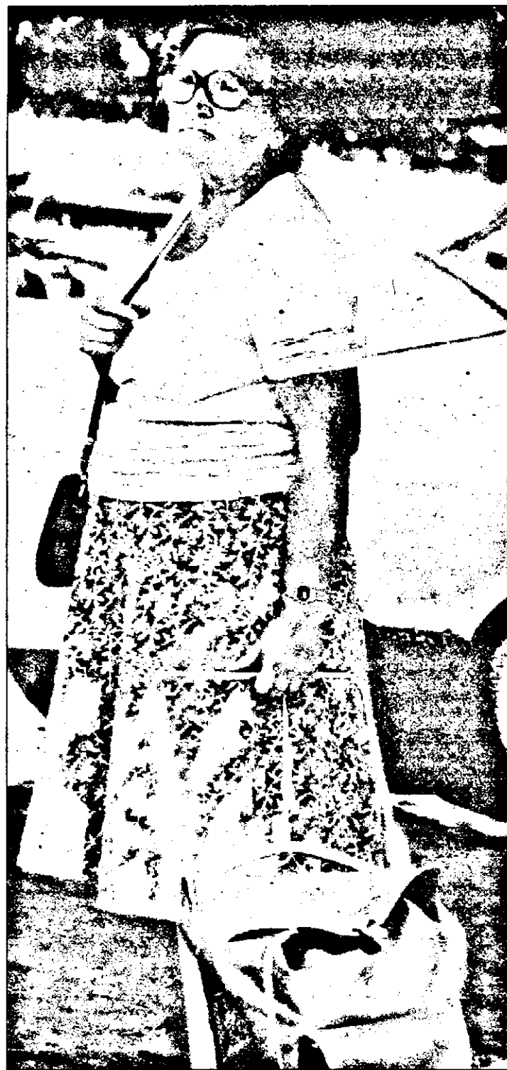
Gândind cu nostalgie la vremurile în care cu o sută de lei - la piață - sacoșa se umplea. Acum nici cu 10.000 lei nu o mai umpli...