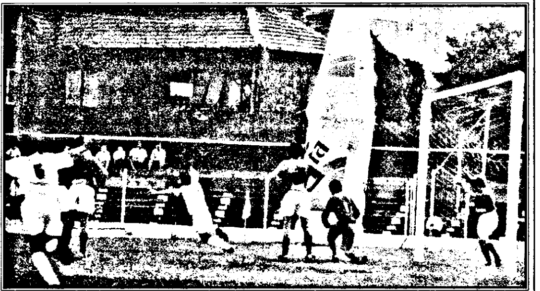
Știrb marchează și UTA s-a calificat în semifinala turneului.