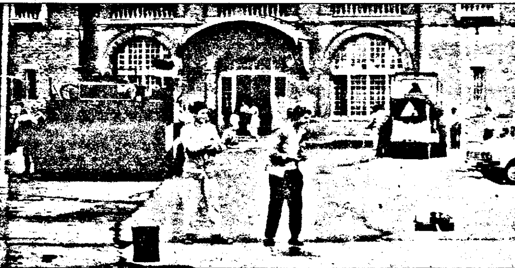
Până în data de 15 septembrie, vor fi finalizate lucrările din zona gării C.F.R. Arad.