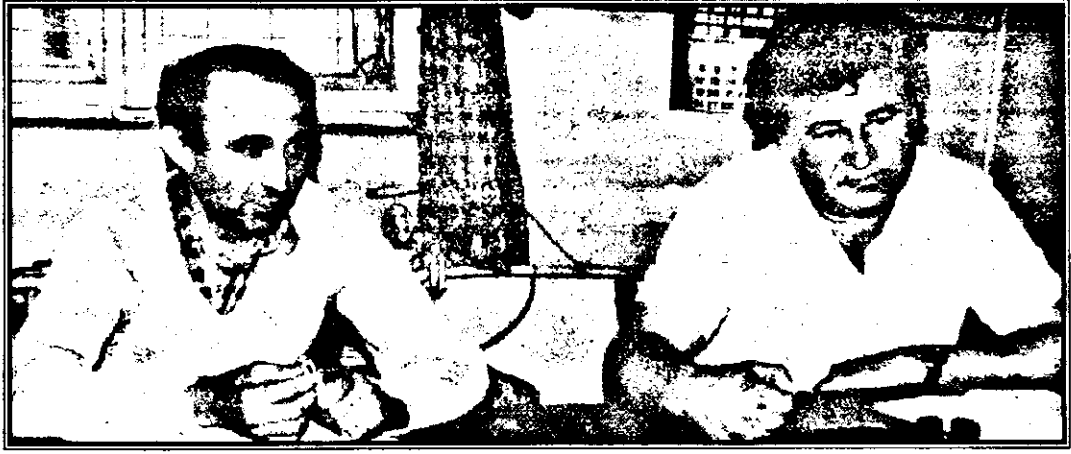
„Suntem ca o mireasă care aşteaptă un mire bogat” - sunt de părere directorul general şi directorul tehnic de la PROMES SA Sebiş. Rămâne de văzut cât de reuşită şi de atractivă va fi găteala „miresei”??!

I.C.: Apropos de perspective, suntem în tratative cu o firmă din Timişoara, pentru asociere. Dacă s-ar realiza ar însemna şi ceva capital în plus şi comenzi... să vedem, cum vor derula lucrurile.