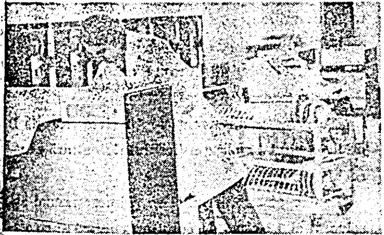
Centrul de calcul de la I.V.A. aduce o contribuție deosebită la buna organizare și deslășurarea a producției întreprinderii.