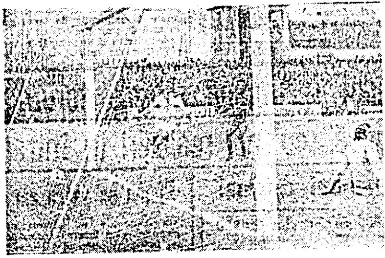
S-a înscris cel de-al doilea gol al textiliștilor...

statam cu bucurie că anul 1979 a fost un an fructuos pentru orientariștii din Arad. Sportivii frunzați ai asociației-