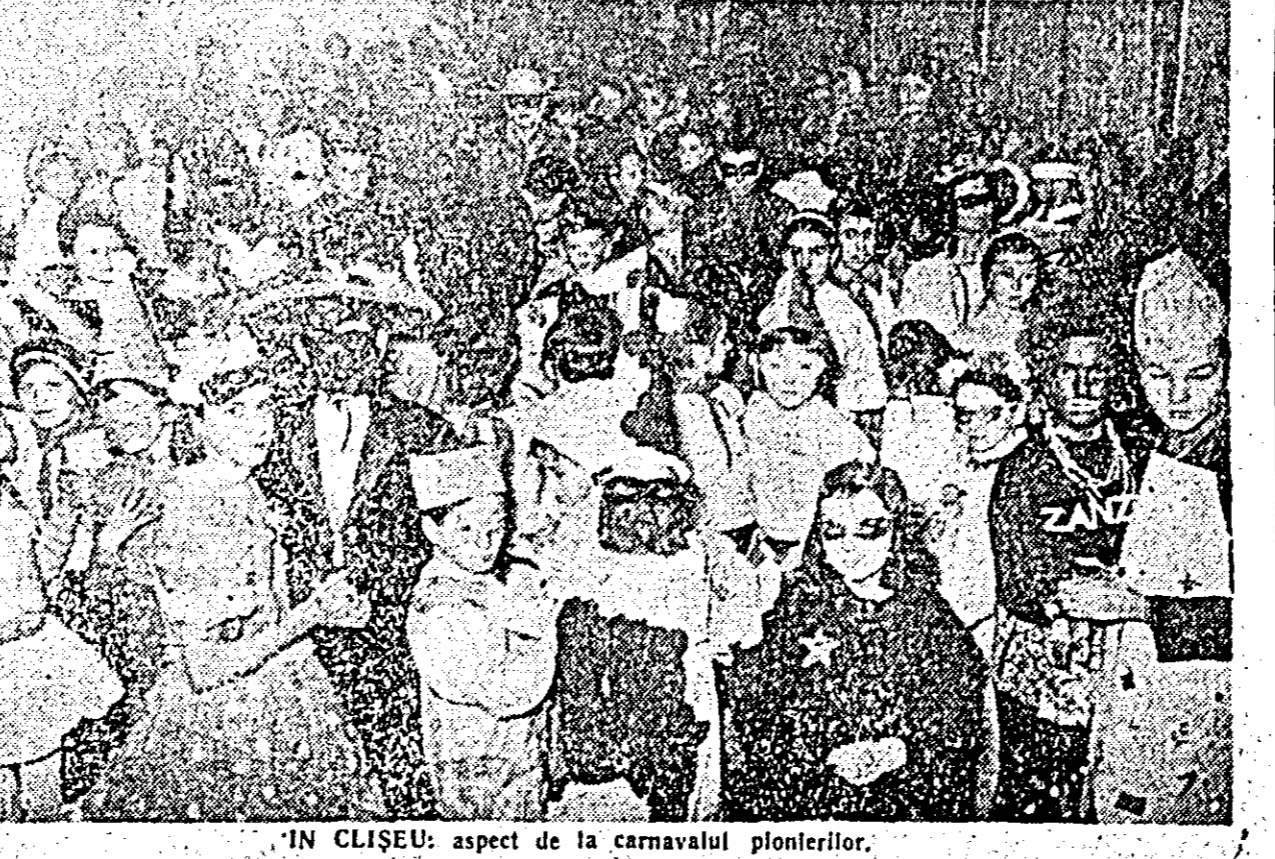
IN CLISEU: aspect de la carnavalul pionierilor.

le revin, Comitetul raional de partid a organizat, începînd ieri, instruirea lor pe centre de comună. Instruirea noilor birouri alese se face de către membrii biroului Comitetului raional de partid.