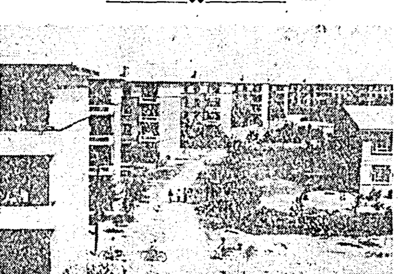
În cartierul Lungtan din Pekin, capitala R. P. Chineze

Stockholm și-a încheiat lucrările cel de-al 20-lea congres al Partidului Comunist din Suedia, care a discutat raportul de activitate al Comitetului Central, programul de acțiune în vederea campaniei electorale din anul 1964, probleme privind arma nucleară și politica militară, programul de îmbunătățire a sistemului de ocrotire a sănătății, politica agrară și politica în domeniul locuințelor.