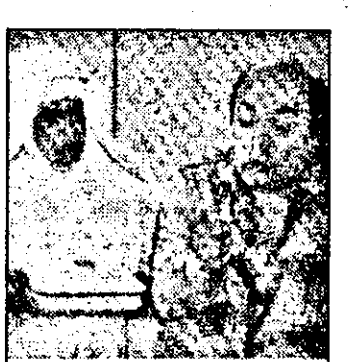
SAT 1: 1,00 Doctoriță în cazarmă - f. erotic FR