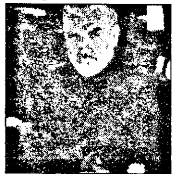
PRO 7: 21,00 Vânătoarea lui „Octombrie Roșu“ - f. acț. SUA

12,55 Știrile Pro TV 13,00 Fort Boyard 14,15 Desene animate: Duckman/ep. 16 14,45 Stelele Olympiei - realizator Monica Bucur (ep.7) *DUMITRU PÎRVULESCU.