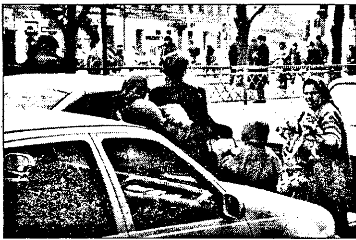
Auzi, mâncați-aș, mai bine ne-ai da o mie de lei, în loc să ne pozezi...