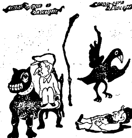
Caricatură de Zeno Oarsă