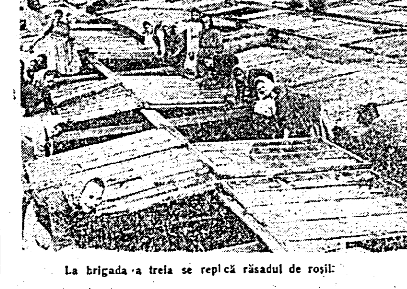
La brigada a treia se replăză răsădul de roșii.