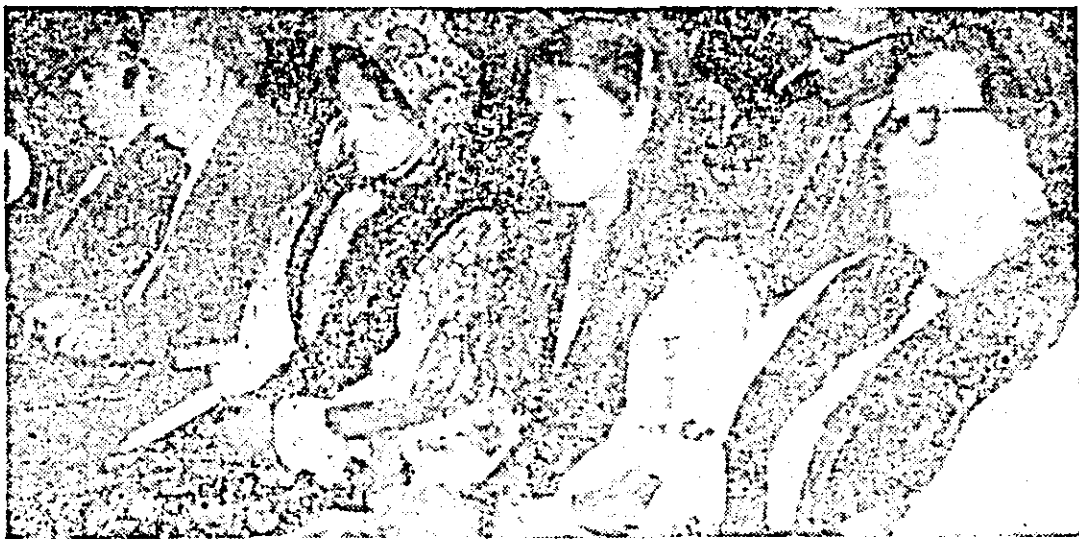
Aspect de la cea de-a IV-a Întâlnire a scriitorilor țărani din România.