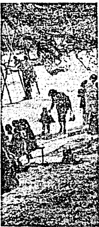
Arad. Primăvară în parcul copiilor.