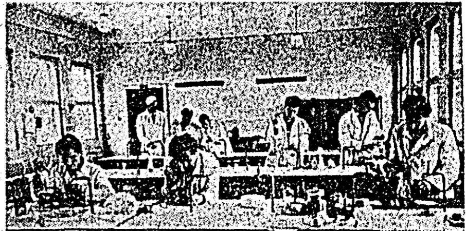
Clișul înfășlează studenții din anul IV de la Facultatea de medicină veterinară făcînd experiențe în laborator, pentru pregătirea examenelor.