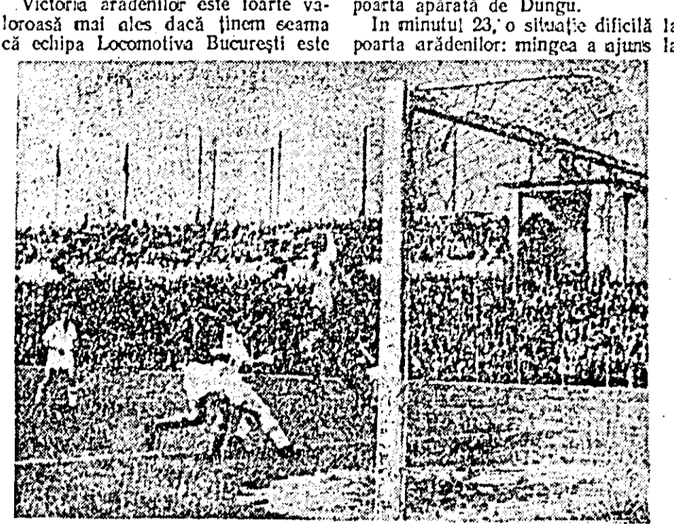
Fază de la meciul Flamura roșie U.T.A.—Locomotiva București

Victoria arădenilor este foarte valoroasă mai ales dacă ținem seama că echipa Locomotiva București este