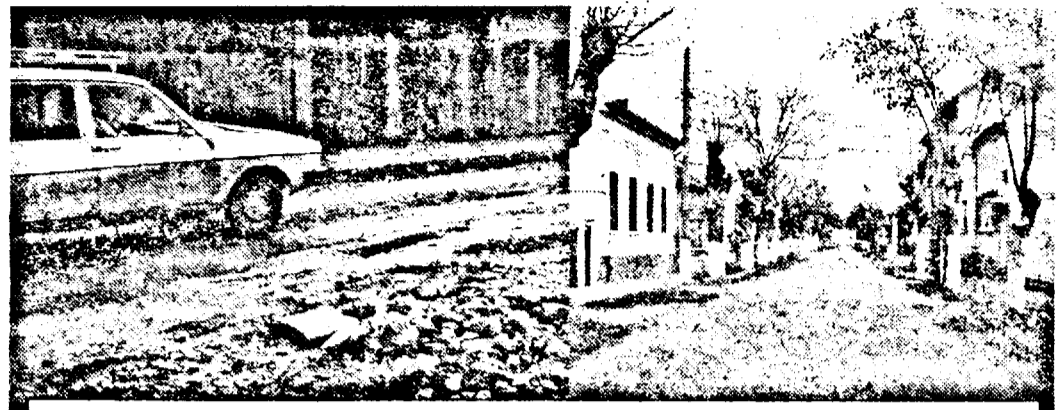
Jumătatea contribuabililor și jumătatea... viceprimarului