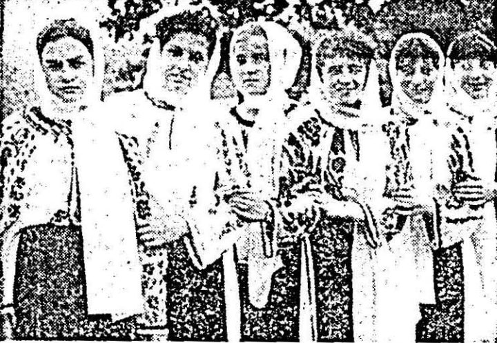
Formația de dansuri populare a căminului cultural din Hălmașu pe scena Festivalului național „Cîntarea României”.

„Nedeia de la Birchiș” În organizarea Comitetului de cultură și educație socialistă al județului Arad și a consiliului comunal de educație, politică și cultură socialistă Birchiș, se va desfășura astăzi, 5 septembrie, începînd cu ora 10,30 „Nedeia de la Birchiș” — într-un pitoresc cadru natural, cunoscut de localnici sub numele „La Goruni” — tradițională sărbătoare populară din această veche așezare românească de pe Valea Mureșului. Își dau concursul cu acest prilej, într-o adevărată întrecere de virtuozitate, soliști vocali și instrumentiști, tarafari, formații de dansuri populare, coruri și grupuri vocale care au obținut rezultate deosebite în cadrul Festivalului național „Cîntarea României” ori se află pe treptele afirmării. Amintim printre acestea grupurile vocale ale căminelor culturale din Birchiș și Căpîlnas, ansamblul de cîntece și dansuri al Casei de cultură Lipova și ansamblul „Rosiana” din Petriș, formații de dansuri populare mixte din Săvișin, Birchiș, Căpîlnas, orchestra de muzică populară a Casei municipale de cultură din Arad și altele. Nedeia va începe cu parada portului popular.