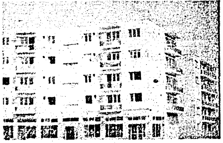
Un nou bloc de locuințe, cu spații comerciale la parter, se află în fază de înșămulțare la Lipova.