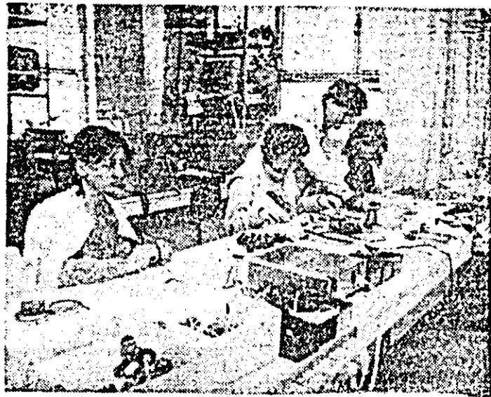
Aspect de muncă în atelierul de asamblare a ceasornicelor cu cuarț de la întreprinderea de orologerie industrială.