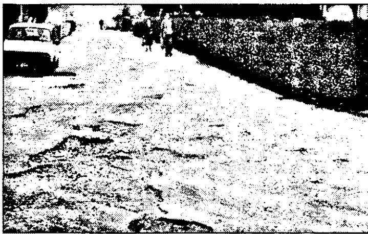
Nu, nu este poligonul vreunei școli de șoferi, cu acele prea cunoscute „porți” de testare a îndemânării, ci Aleea Saturn din Arad. Câte nu sunt însă ca ea...