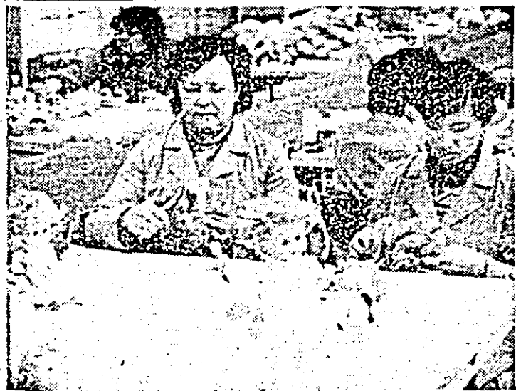
Aspect de muncă la întreprinderea „Arădeanca”.

Zootehnia — la nivelul cerințelor noii revoluții agricole. Secvențe din două ferme — Cuvia și Covăsinț.