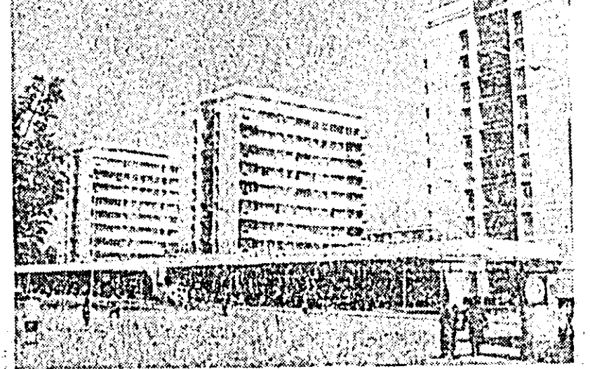
Blocuri noi în Piața gării din Bacău.

Seria agregatelor de foraj pentru mari adîncimi produse de industria noastră constructoare de mașini a fost completată cu o nouă instalație — 4DH-315, omologată recent la Uzina „1 Mai” din Ploiești. Echipată cu patru motoare Diesel de 700 C.P. fiecare și convertizoare hidraulice de cuplu, noua instalație este destinată pentru forajul sondelor de 110 și gaze pînă la adîncimi de 7.000 metri, cu prăjini de 4,5 toli. Sarcina ei nominală de lucru (la cîrlig) este de 315 tone. Instalația este prevăzută cu pompe de noroi de mare putere care asigură o presiune pînă la 200 kilograme — forță pe centimetru pătrat. Avînd dotare completă, această instalație este aptă atît pentru forajul sondelor de exploatare, cît și de explorare. Turla instalației, de formă piramidală, are o înălțime, măsurată de la podul sondei, de 51 metri. Construită cu un înalt grad de centralizare și mecanizare a componentelor, instalația 4DH-315, proiectată în întregime în țara noastră, poate fi condusă de la pupitrul sondeului șef.