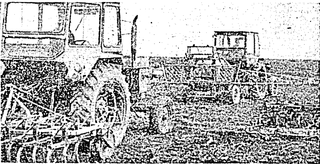
La cooperativa agricolă din Siclau se acționează intens la pregătirea și erbicidarea terenului pentru floarea-soarelui.

plan. Sînt avansate unitățile agricole cooperatiste din C.E.A.S.C. Sintana, Felnac, Nadlac, Arad, dar trebuie urmat ritmul de lucru în cele din consiliile unice Pecica, Chișineu Cris, Cormeș, Beliu și Timova, rămase în urmă. Totodată, să se treacă cu toate forțele și la în sămînțatul porumbului și florei-soarelui, acționîndu-se cu cuplaje de utilaje pentru mărirea vitezei zăpezii și economisirea energiei.