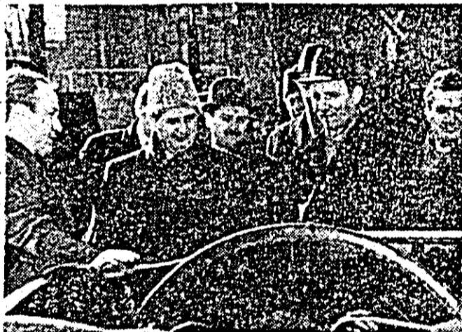
Momento de neuitat: tovarășul Nicolae Ceaușescu în mijlocul constructorilor de vagoane.

de două luni, din volumul total de locuințe pe care trebuie să-l execute, întreprinderea a realizat 144 apartamente, are în stadiu de finisaj 720, la structură 679, la fundație 2036, iar restul, adică 798, n-au fost încă începute. Cum durata normală de execuție a unui bloc este de circa trei luni din care circa două luni se lucrează la finisaje, înseamnă că întreprinderea și-a organizat necorespunzător lucrările în sensul că nu creează, în mod eșalonat, front de lucru pentru toate categoriile de muncitori și nici pentru cei care s-au angajat să-l ajute.