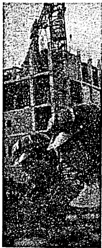
Pe șantierul platformei de nord-vest din municipiu, constructorii înalță noi obiective industriale.

La invitația tovarășului Nicolae Ceaușescu, secretar general al Partidului Comunist Român, președintele Republicii Socialiste România, generalul de corp de armată Mobutu Sese Seko Kuku Ngbendu Wa Za Banga, președintele fondator al Mișcării Populare a Revoluției, președintele Republicii Zair, va efectua o vizită oficială în România, în a doua parte a lunii martie a.c.