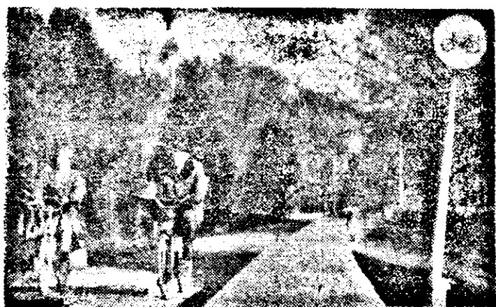
Faleza Mureșului e dorim cu toții ca loc de promenade, dar... pietonală.