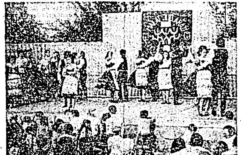
„Nunta slovacă” — Foto: FR. KELEN

Se apropie și ora începerii programului cultural. Dinspre capă- „Nunta slovacă” — Foto: FR. KELEN