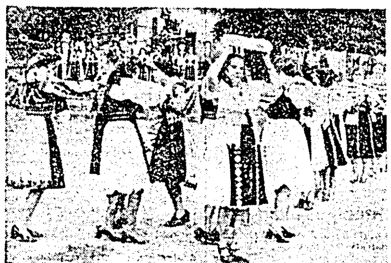
Jocul „Roata”