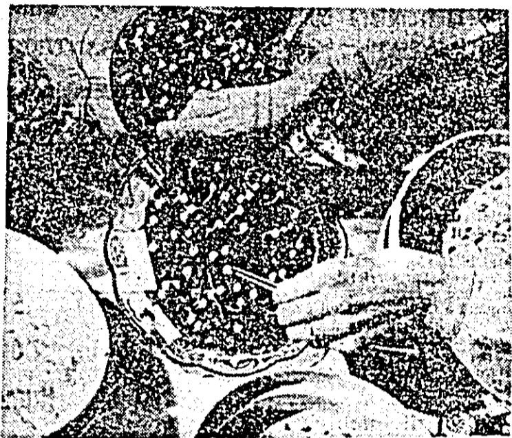
Pentru producția de grâu a anului ce vine, numai sămînța verificată, de primă calitate.