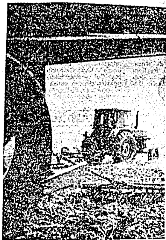
După ce o recoltă a părții terenului, alta li la locul. Pe ogoarele unităților agricole de stat și cooperative din județul nostru, astfel de imagini, care reprezintă pe mecanizatorii întorcînd brazdă nouă pentru viitoare recoltă de grâu, sînt frecvente.

tea solurilor acide, dar în cazul spumei de var doza se va da în cantitate dublă, întrucît conținutul în carbonat de calciu al amendamentului respectiv este de 40—43 la sută. Pentru a esalona perioada de recoltare este necesară o structură optimă a soiurilor, astfel ca fiecare unitate să cultive cel puțin 3 soiuri de grâu diferite cu perioadă de vegetație, acordîndu-se prioritate soiurilor timpurii. În ce privește semănatul grâului s-a stabilit să înceapă la 15 septembrie și să se încheie la 15 octombrie. În perioada 15 septembrie—30 septembrie în zona colinară se va însămînța 50 la sută din suprafața planificată iar în cea de șes în perioada 25 septembrie—1 octombrie se va realiza 30—40 la sută din plan. Spre deosebire de anii precedenți, semănatul va începe în zilele soiurilor tardive și se va încheia cu cele precoce. Semănatul orzului se va efectua între 20 septembrie și 1 octombrie, aplicîndu-se 130—140 kg la hectar, întrucît cantitățile mai mari de sămînță duc la căderea plantelor.