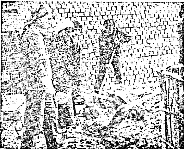
Pe șantiere, la școala muncii, tinerii se pregătesc pentru muncă, pentru viață.