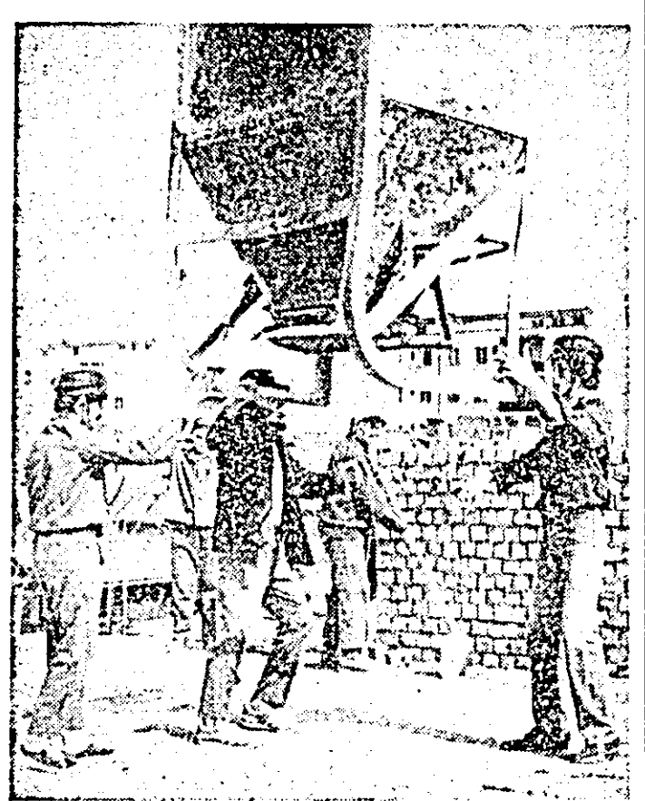
Activitate febrilă, zi de zi, pe șantierul județean al tineretului din Calea Aurel Vlaicu: „A sosit betonul”.

Cu gândul la apropiatele evenimente de o deosebită importanță din viața poporului nostru, Ziua internațională a celor ce muncesc și aniversarea a 60 de ani de la crearea Partidului Comunist Român, tinerii din Vinga nu precupețesc nici un efort pentru a-și îndeplini angajamentele luate. În special, cei de terminare a lucrărilor de construcție a acestui complex, participînd concomitent și la lucrările din agricultură pentru a contribui și ei la obținerea de recolte cât mai bogate.